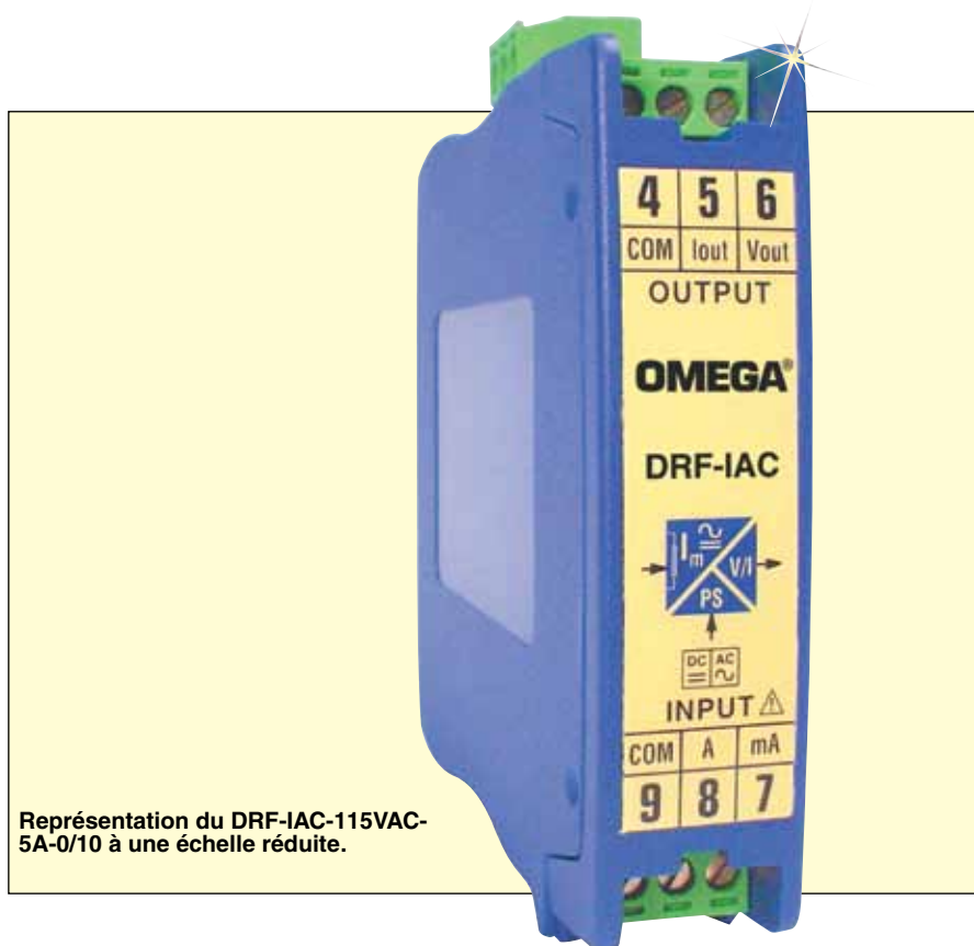
Représentation du DRF-IAC-115VAC-5A-0/10 à une échelle réduite.

Protection contre le dépassement des limites : 7,5 A pour les plages supérieures à 500 mA et inférieures ou égales à 5 A, 750 mA pour les plages inférieures ou égales à 500 mA