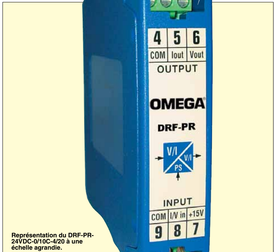
Représentation du DRF-PR-24VDC-0/10C-4/20 à une échelle agrandie.

Sortie Vexc pour transducteurs : +15 Vcc ±10 % (22 mA max.)