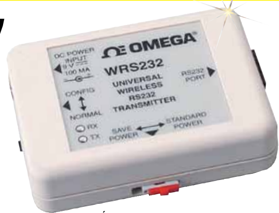
Émetteur sans fil WRS232-USB, représenté à une échelle quasi-réelle.

Communications sans fil entre l'instrument et le PC :