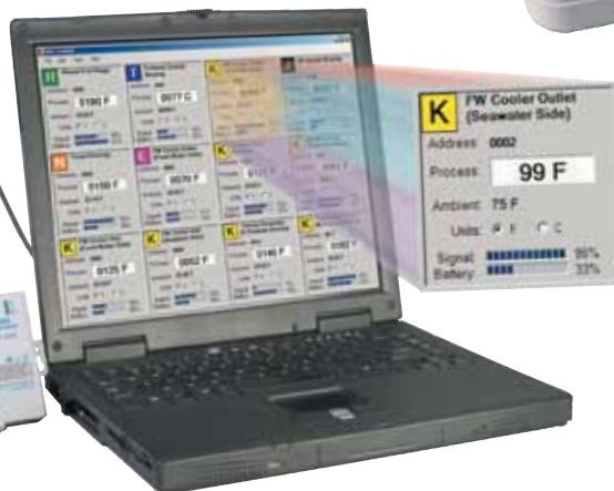
Ordinateur portable non fourni.

UWTC-REC2, disponible avec sortie de thermocouple 4 à 20 mA, 0 à 5 Vcc, 0 à 10 Vcc et de type K.