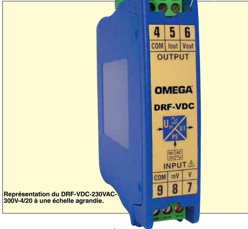
Représentation du DRF-VDC-230VAC-300V-4/20 à une échelle agrandie.

Protection contre les surtensions : 1 000 V pour les plages supérieures à 100 V, 500 V pour les plages inférieures ou égales à 100 V