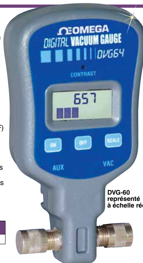
DVG-60 représenté à échelle réduite.

Exemple de commande : DVG-64, manomètre à vide numérique.