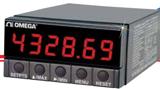
DP41-B, représenté à échelle réduite. Pour plus d'informations, consultez omega.fr/dp41b