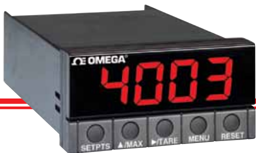
DP25B, représenté à échelle réduite. Pour plus d'informations, consultez omega.fr/dp25b